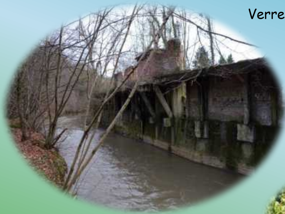
Verrerie de Beignée