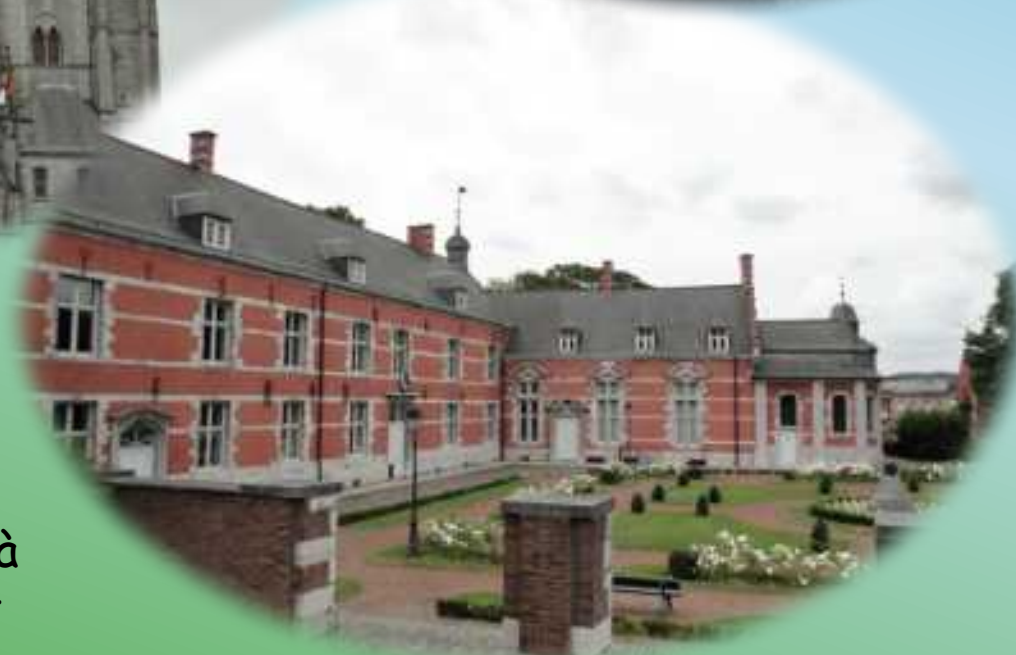
Le Château Cartier à Marchienne-au-Pont