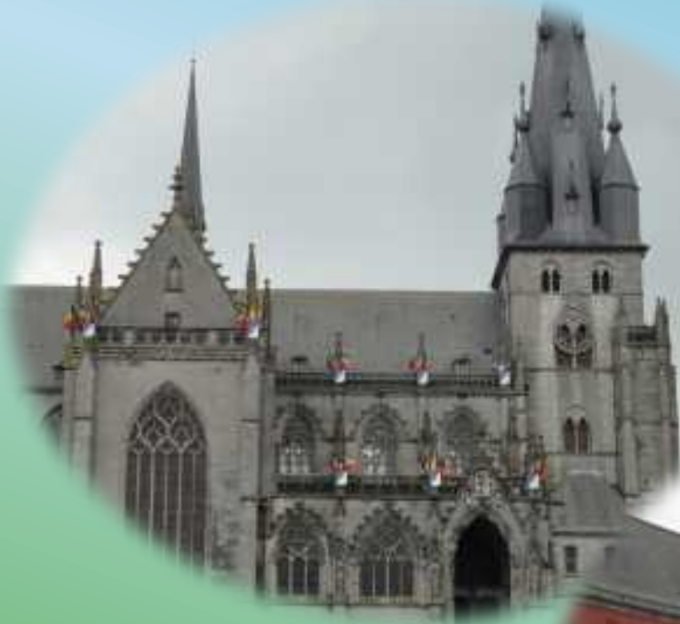
La basilique de Walcourt