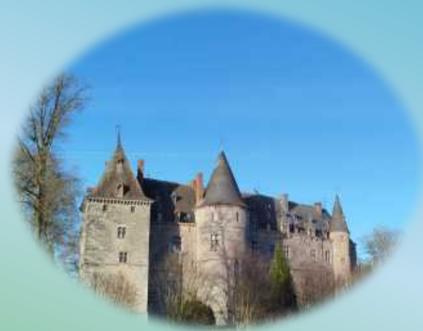
Le Château d'Ham-sur-Heure