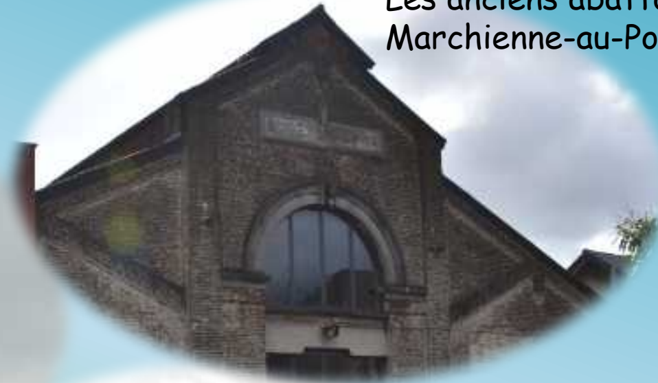
Les anciens abattoirs de Marchienne-au-Pont